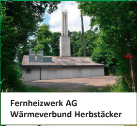
Fernheizwerk AG Wärmeverbund Herbstäcker